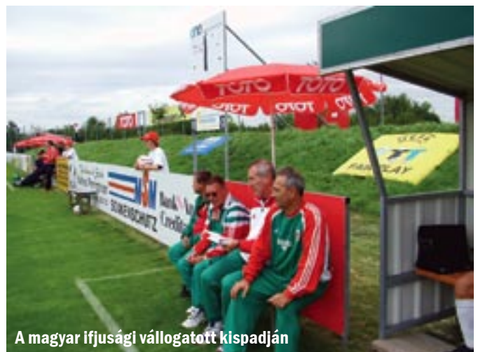
A magyar ifjúsági válogatott kispadján