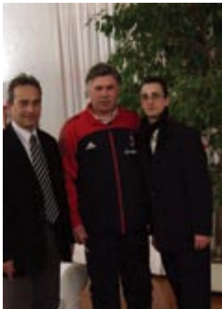
Ancelottival, a Milan edzőjével