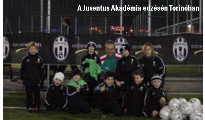
A Juventus Akadémia edzésén Torinóban

hete, ahol remélem sok új szak- mai újdonsággal fog bennünket is tájékoztatni. Ezekről rendszer- es szakmai írás olvasható majd a www.olaszfoci.hu -n.