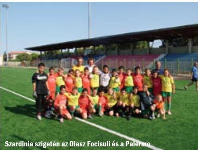
Szardínia szigetén az Olasz Focisuli és a Palermo