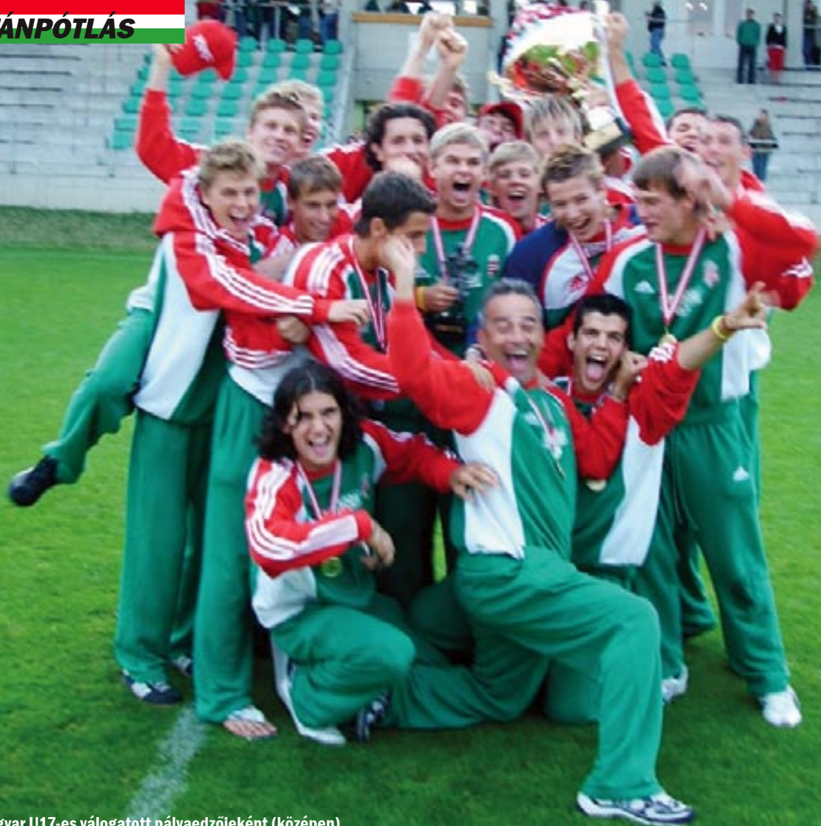
A magyar U17-es válogatott pályaedzőjeként (középen)