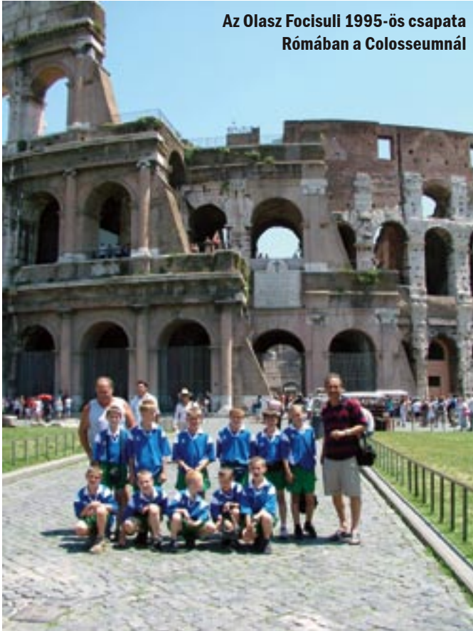
Az Olasz Focisuli 1995-ös csapata Rómában a Colosseumnál