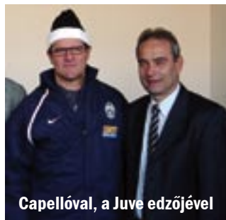
Capellóval, a Juve edzőjével

„SOKAT VÁLTOZOTT AZ UTÓBBI IDŐBEN AZ UTÁNPÓTLÁS MEGÍTÉLÉ- SE. AKIK AZ ÚJ KÉPZÉST ELKEZDTÉK, ABBAN NŐ- NEK VAGY CSEPERED- NEK FEL, VÁLHAT BE- LŐLÜK NEMZETKÖZI SZINTŰ LABDARÚGÓ.”